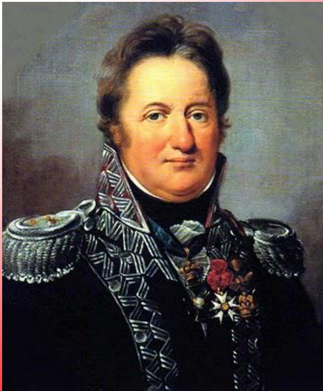
Jan Henryk Dąbrowski