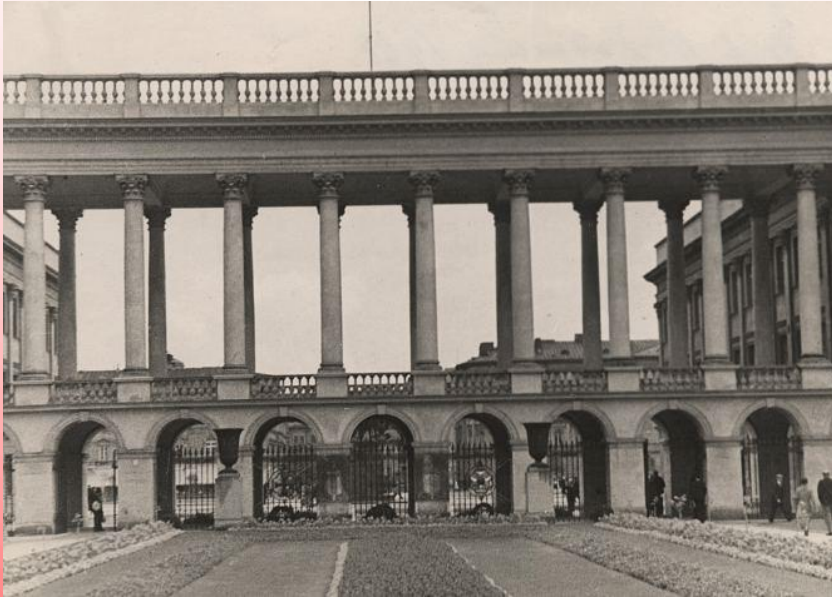
Zdjęcie z 1939 roku